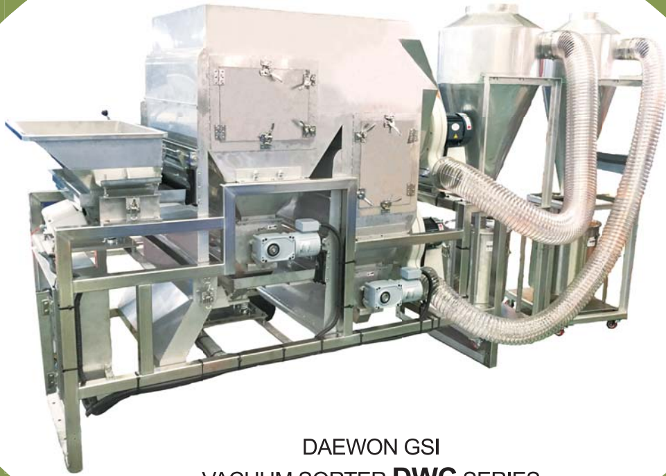
DAEWON GSI VACUUM SORTER DWC SERIES (DWC-200K)